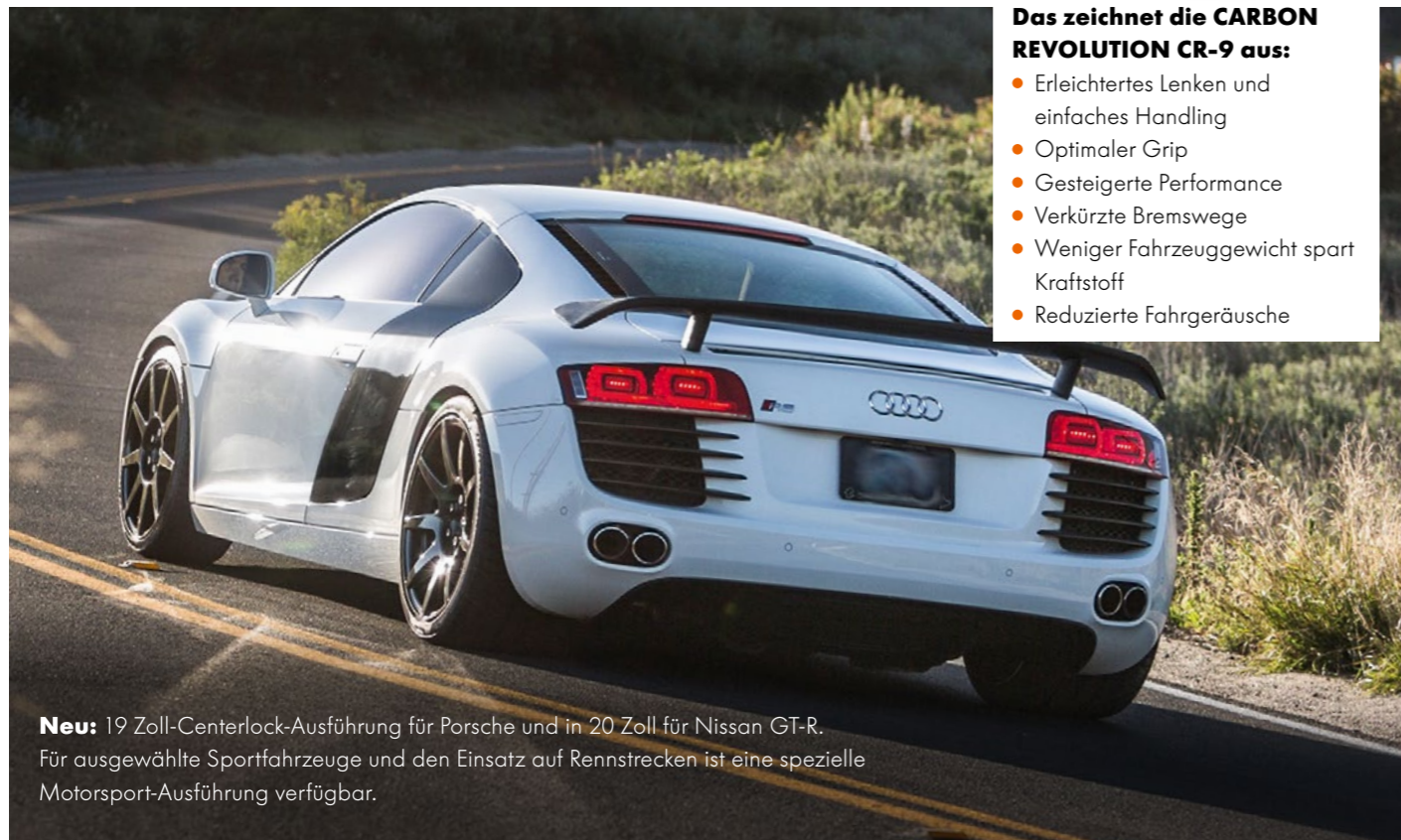
Neu: 19 Zoll-Centerlock-Ausführung für Porsche und in 20 Zoll für Nissan GT-R. Für ausgewählte Sportfahrzeuge und den Einsatz auf Rennstrecken ist eine spezielle Motorsport-Ausführung verfügbar.