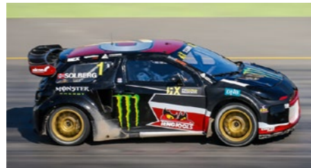
Petter Solberg, World Rallycross Team FIA World Rallycross Championship, Estering, Deutschland