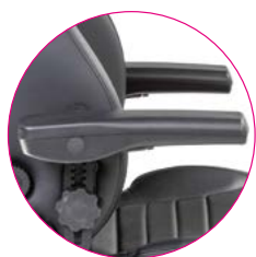
Flip-Up Arm inkl. Höhenverstellung