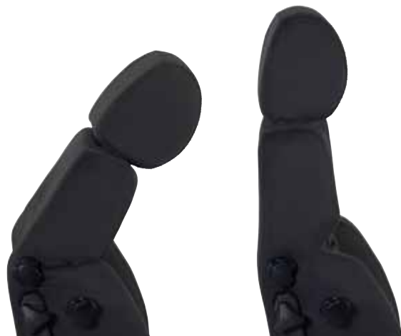
Abb. können Optionen enthalten.

Die HWSV bietet eine zusätzliche Verstellmöglichkeit im oberen Lehnbereich zur Unterstützung der Halswirbelsäule. Insbesondere am Übergang der Halslordose zur Brustkyphose ist durch diese Einstellmöglichkeit eine optimale Anpassung an die individuell doch sehr unterschiedlichen Stützbedürfnisse möglich.