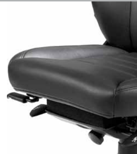
Abb. können Optionen enthalten.

Das Sitzkissen lässt sich damit an die individuelle Oberschenkelgröße anpassen, um Druck und Blutstau an den Kniekehlen zu verhindern. Durch diese Einstellmöglichkeit wird die gleichmäßige Stützung der Oberschenkel und damit deren muskelstatische Entlastung bewirkt.